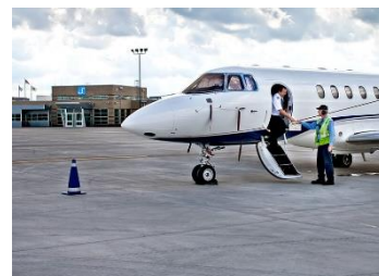
①機側から専用施設にご移動